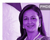
Kátia Abreu (PMDB)