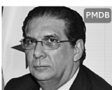
Jader Barbalho (PMDB)