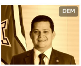
Davi Alcolumbre AP