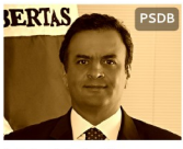
Aécio Neves MG