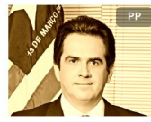
Ciro Nogueira PI