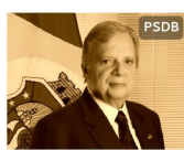
Tasso Jereissati CE