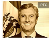
Fernando Collor AL