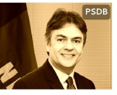
Cássio Cunha Lima PB