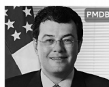
Eduardo Braga (PMDB)