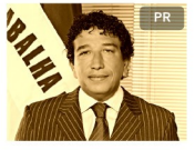
Magno Malta ES