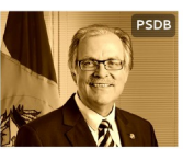
Dalirio Beber SC