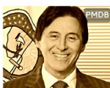
Eunício Oliveira (PMDB)