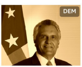
Ronaldo Caiado GO