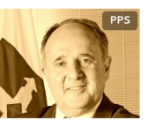
Cristovam Buarque DF